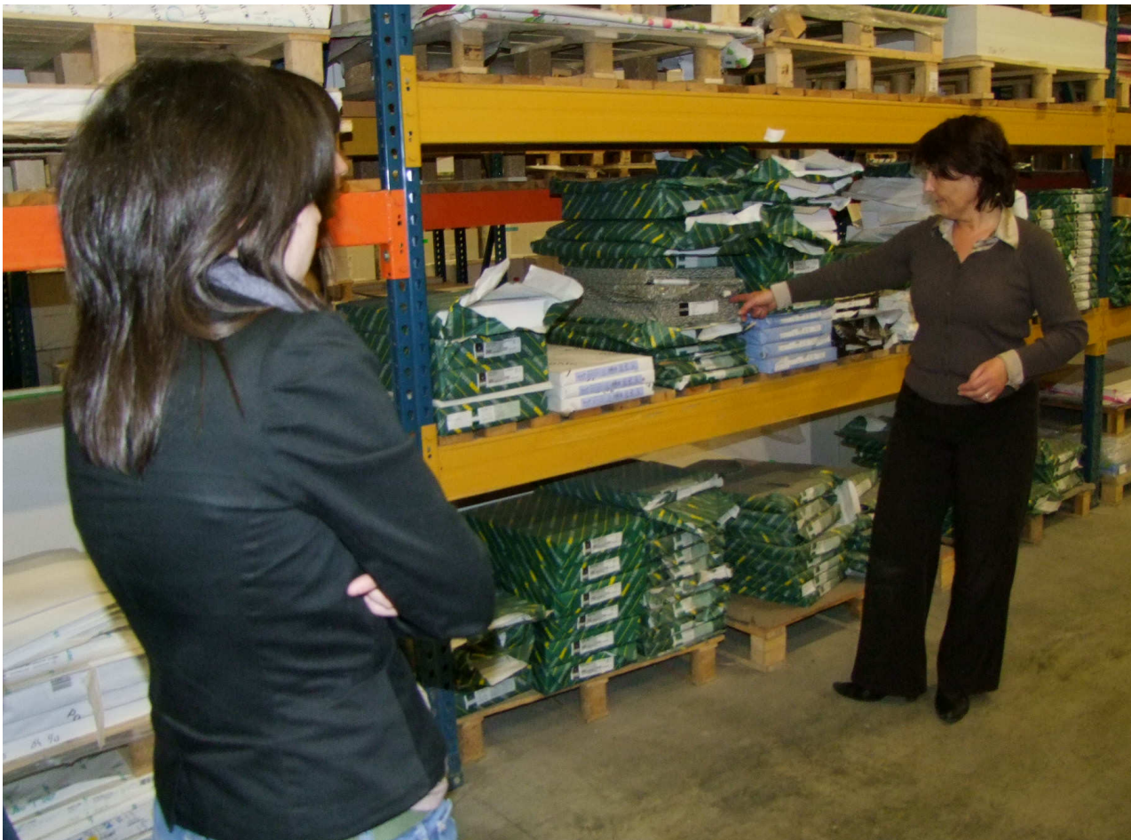
Découverte d'une nouveauté : « le papier aux algues »