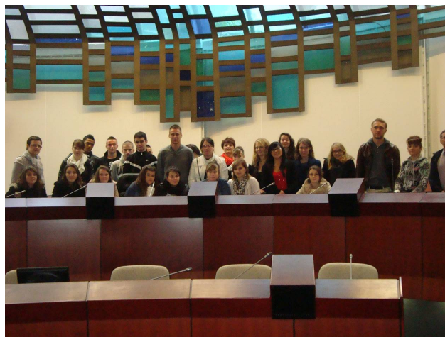
Le groupe dans l'hémicycle du Conseil Régional