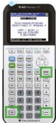
TI 83 CE