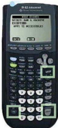
TI 82 Advanced